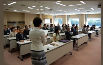
役職者研修のようす（会場：ファーラ）